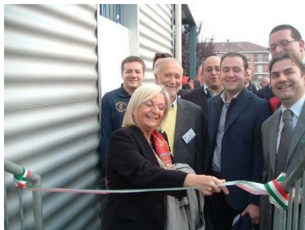
Taglio del nastro con autorità